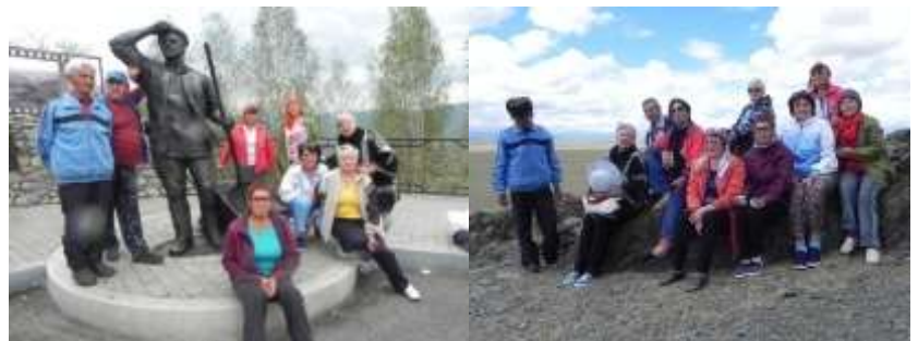
Экспедиция: »Шебалино – Онгудай – Кош - Агач С 31 июля по 2 августа, 2017 г.