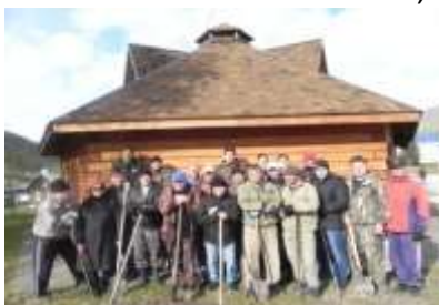
Добровольные помощники за работой