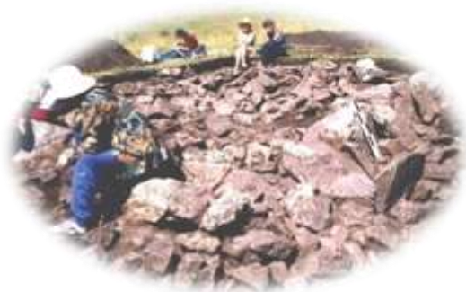
Июль 2002 г., окрестность села Шебалина.

Мы создали краткий летопись, т. е. отчет за 15 лет.