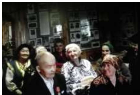
Вечер – встреча «Мы дети суровых лет», С воспитанниками и воспитателями Шебалинского детдома.