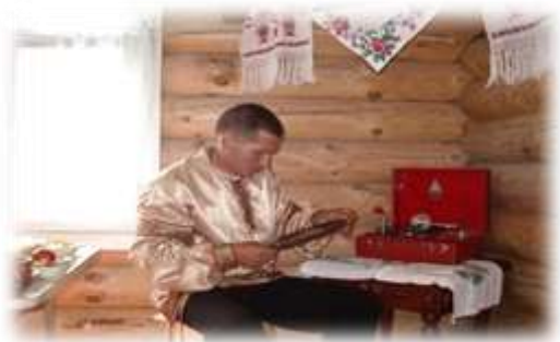
«Хозяин горницы», в конкурсе «Русская горница» завоевала Гран-при. Июль 2005 г Чойский район.

В июле 2005 года на празднике «Родники Алтая» в Чойском районе этнографическая горница музея в конкурсе «Русская горница» завоевала Гран-при.