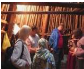
Инженеры из г. Москвы В этнографическом аиле Июль 2017г.