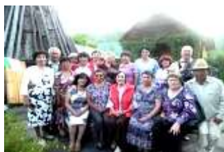
Участники музейной ночи.