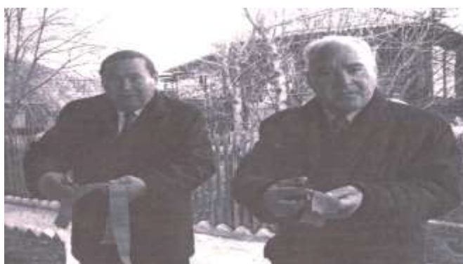
Глава Шебалинского района А. Б. Соколов и Глава Республики Алтай М. И. Лапшин разрезали ленту.