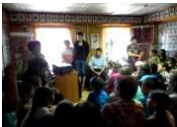
Музейный урок по теме «Патриотизм», 14. 06 2017 Фотографии