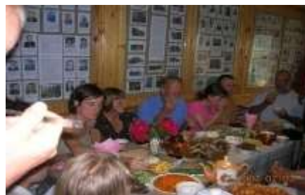
Иностранная группа. Дегустация алтайских национальных блюд.