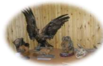
Начали создавать отдел «Природы» музея.