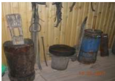
Экспонаты этнографического аила.