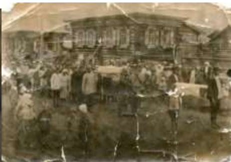
Историческая фотография для выставочной – экспозиции в музее.