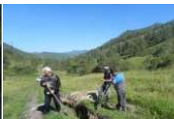
Экспедиция за артефактами (кости мамонта).