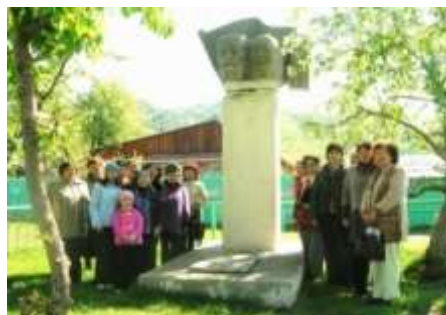
Экскурсия по историческим местам с. Шебалина. Май 2010

На встречу: «Не расстанусь с комсомолом, буду вечно молодым!», были приглашены работники Шебалинского РК ВЛКСМ разных лет. К вечеру подготовлена экспозиционная выставка «Не расстанусь с комсомолом, буду вечно молодым!», собран и обработан материал на 36 человек, о работниках РК ВЛКСМ и на 14 фото-экспозиций. Выпущено 25 пригласительных билетов.