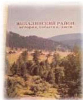
Книга «Шебалинский район: история, события, люди»

В 2007 году работа была направлена на расширение музея в связи с его пятилетним юбилеем. В результате подготовки к юбилею завершилось строительство и оборудование этнографического комплекса, этнографический аил (аланчик) и русская изба.