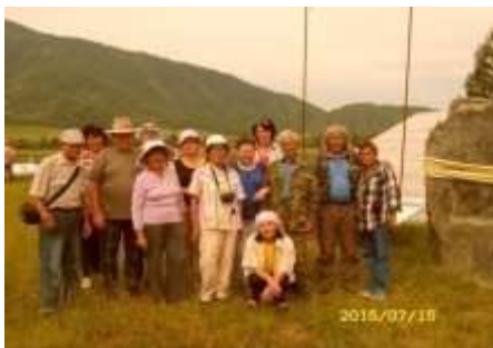
Экспедиция: Онгудайский район Заповедник «Уч Элмек». 2015 г.