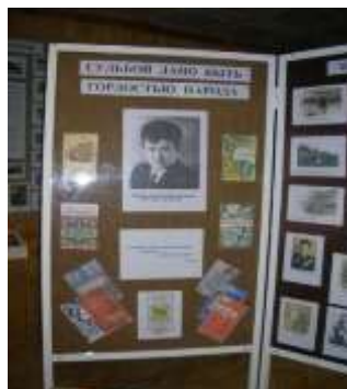
Выставка к 75 – летию Л. В. Кокышева