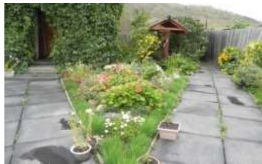
Территория музея. лето 2017 г.