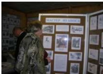
Выставка «Мастер из Аноса»

Проведено 68 экскурсий, тематических – 52 (о жизни и творчестве Г. И. Чорос-Гуркина; по Великой Отечественной войне; по историческим местам с. Шебалино для психологов школ республики; по этнографии алтайского народа с дегустацией алтайских национальных блюд для Группы военнослужащих из разных городов Российской Федерации; о Государственной символике). Обзорных экскурсий – 16 (одна с дегустацией алтайских национальных блюд для работников Центра семьи и детей из г. Москвы и Горно –Алтайска).